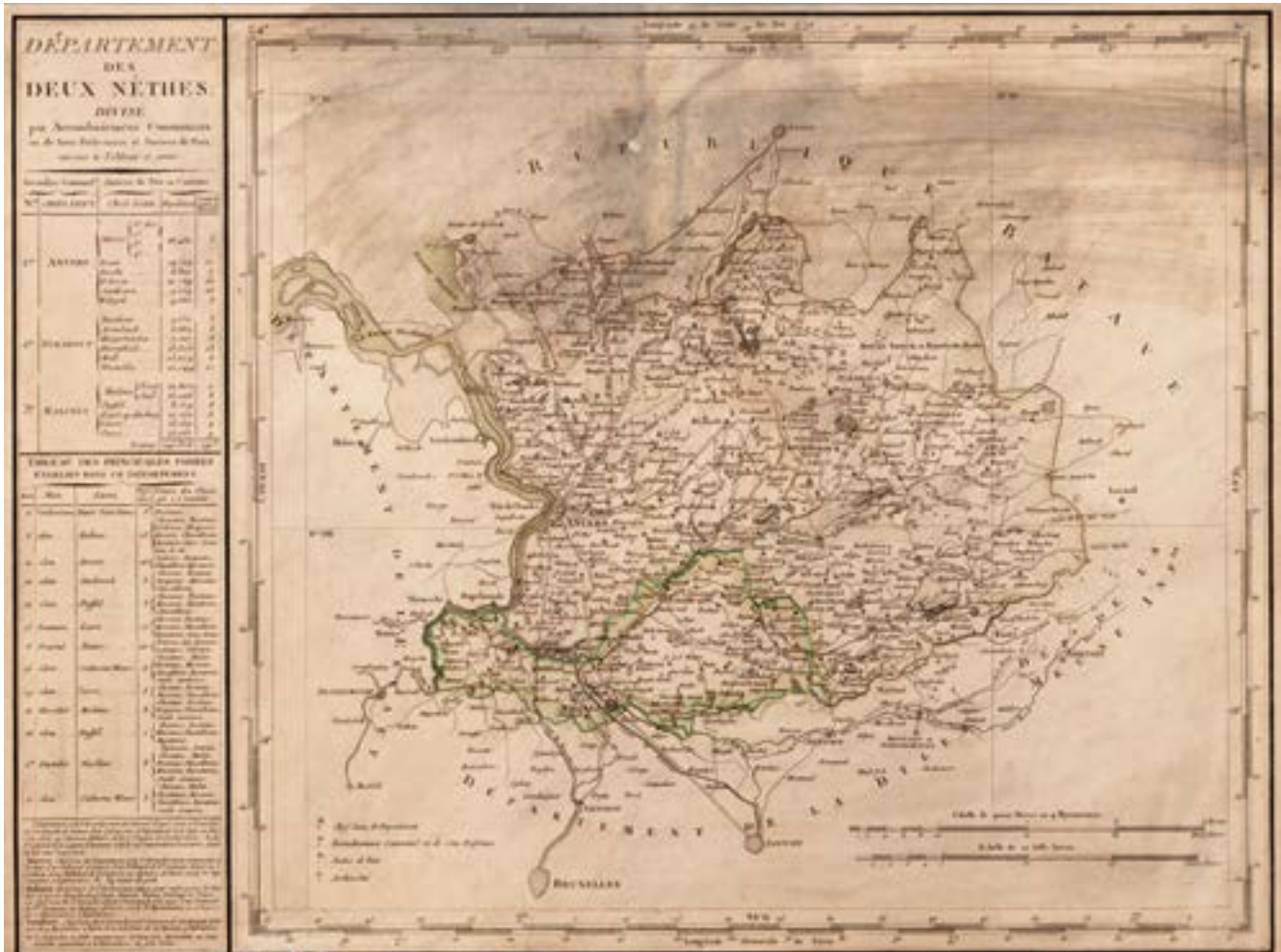
Kaart van het Departement van de Twee Neten, bron: Regionale Beeldbank Mechelen.

Departement van de Twee Neten bestond uit drie arrondissementen – Mechelen, Turnhout en Antwerpen – die elk hun eigen correctionele rechtbank hadden.