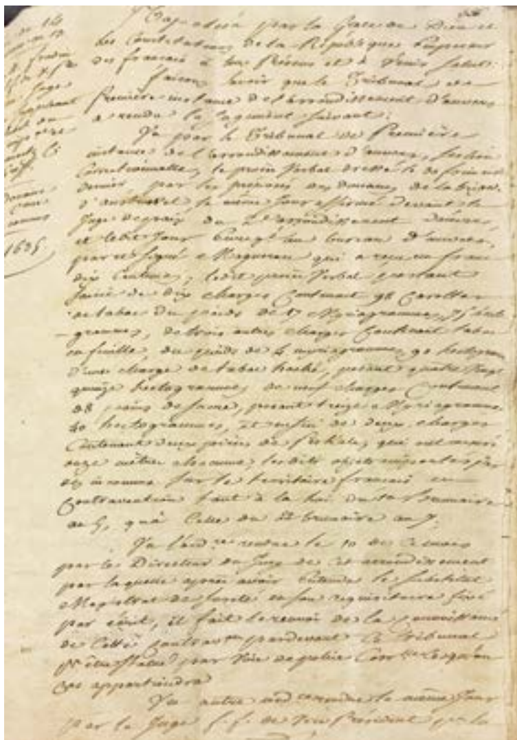
Voorbeeld van een vonnis tegen des inconnus. 14 nivose an 13 (4 januari 1805), bron: R.A.A. EA Antwerpen C 0000, inv. nr. 114.

partij. Dan volgde de basis waarop het vonnis gebaseerd was, waaronder een samenvatting van het proces-verbaal met daarin eventueel het tijdstip, transportmiddel, plaats van inbeslagname, aantallen smokkelaars enzovoorts, alsook een verwijzing naar het overtreden wetsartikel. Steevast werd er dus beargumenteerd waarom een veroordeling of een vrijspraak werd gedaan en waar deze op gebaseerd was. Uiteindelijk volgde daarna het daadwerkelijke vonnis.