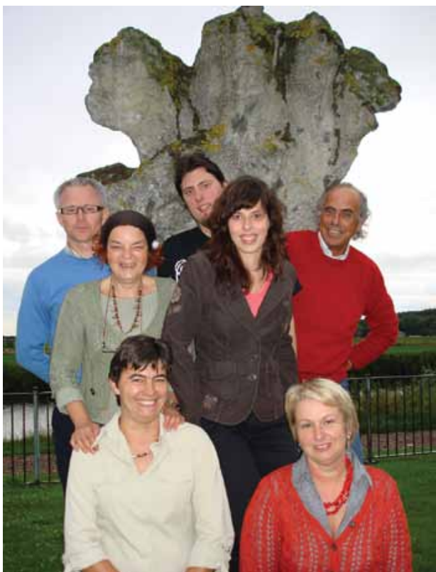
Erfgoedwerkgroep 2007: een samenwerkingsverband tussen de heemkring, het Davidsfonds, het André Demedts-huis en de cultuurdienst Wielsbeke

Mijn heemkundige verhaal leek ten einde, maar (gelukkig) wisten de andere jonge bestuursleden mij te overtuigen om toch nog de redactie van Leiesprokkels verder af te werken. De redactieraad was eigenlijk voornamelijk de verzameling van de jonge bestuursleden, waardoor de Leiesprokkels-Jaarboeken fris en modern waren, maar vaak botsten met de rest van de bestuurswerking. In de periode die ik hier schertsend 'het grote schisma' noem, had de Juliaan Claerhout-kring eigenlijk twee 'kampen': enerzijds het algemeen bestuur en anderzijds de redactieraad. Beide kwamen ook steeds meer los van elkaar te staan. Het bestuur besliste nog steeds over alles, al werd Leiesprokkels alleen nog maar ter info op de agenda geplaatst. De redactieraad begon echt haar eigen leven te leiden. De jongeren hokten daar samen en zetten zich een beetje af tegen de oudere bestuursleden. We wilden als jongere echt iets concreets doen, vooruit gaan, in plaats van oeverloos te praten in vergaderingen. Het moest allemaal erg concreet zijn om er onze aandacht bij te houden. De redactieraad bleek de ideale manier voor ons, jongere bestuurs-