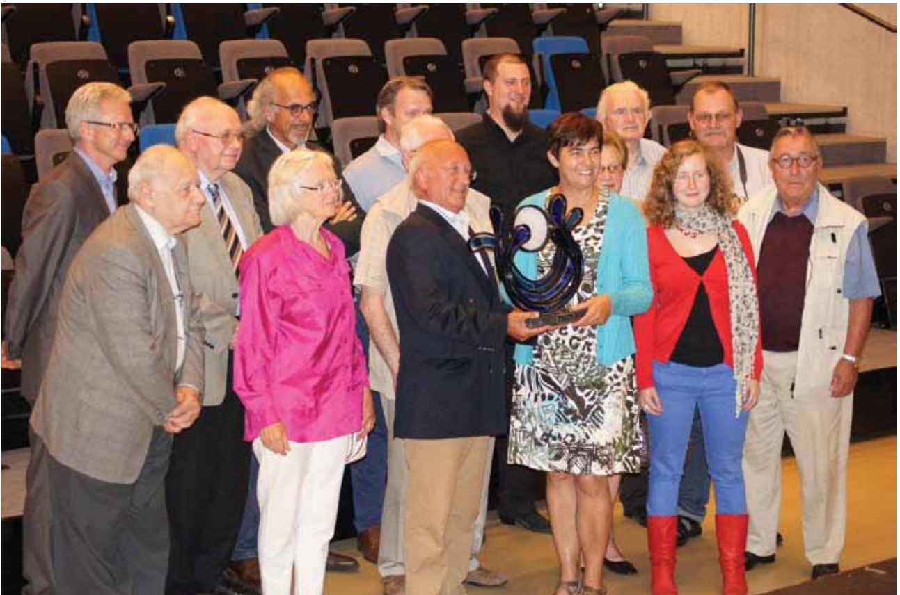
Juliaan Claerhout-kring wint Juliaan Claerhout-prijs