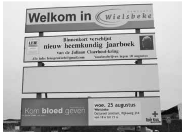
Voorbeeld publiciteitsborden heemkring

De grotere betrokkenheid van de jongere bestuursleden zorgde ook voor een modernere en frissere communicatie die onze heemkring bijna hip maakt. Er wordt sterk ingezet op zichtbaarheid en herkenbaarheid van de Juliaan Claerhout-kring en de Leiesprokkels-Jaarboeken, o.a. door het verspreiden van A2-affiches in vierkleurendruk, publiciteitsborden van drie meter breed langs de Wielsbeekse invalswegen en frisse folders, allemaal ontworpen door jonge, beginnende vormgevers die als losse publiciteitsmedewerker bij de heemkring betrokken zijn. Ook de nieuwe sociale media worden niet ge-