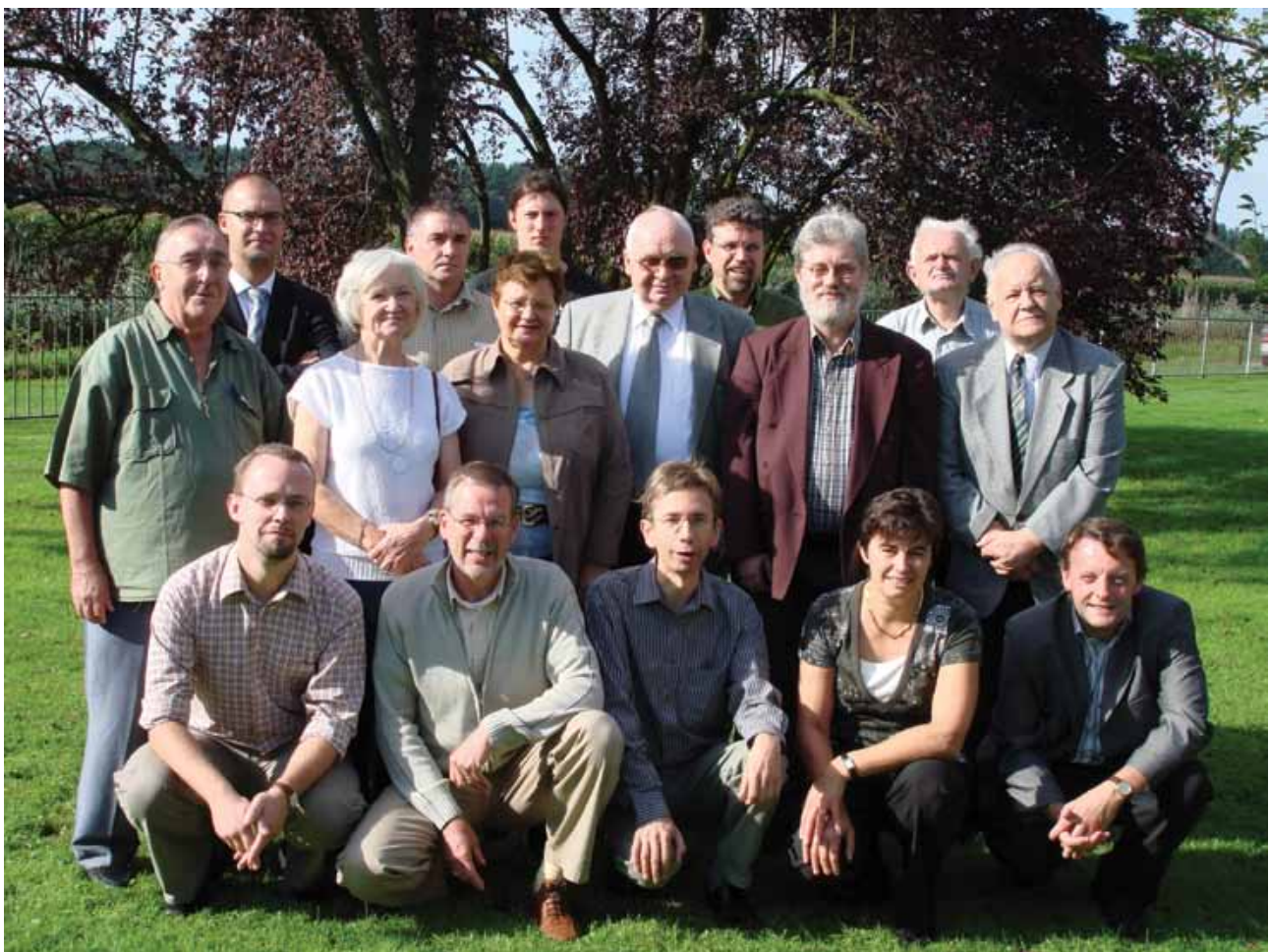
Auteurs en bestuur 2005-2006

ik informatie vroeg aan de plaatselijke heemkring werd ik bijna verplicht om – als ik informatie wilde – ook in het bestuur te komen. Omdat ik meestal een brave jongen ben, ging ik uiteindelijk in op de uitnodiging om een bestuursvergadering bij te wonen. Ik was 19 jaar en ik stond op dat moment bijna met één been in een heemkring. De eerste vergadering vergeet ik nooit. Niet alleen omdat ik mij opeens wel heel erg een snotneus voelde, maar vooral omdat de voorzitter die vergadering ontslag nam. Wat volgde was een chaotische avond, waar zelfs ik even als voorzitter werd voorgedragen. Het angstzweet brak me net niet uit, maar overweldigd was ik zonder meer. Zo erg zelfs dat ik even niet wist of ik wel in het bestuur wilde gaan.