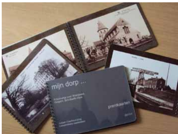
Nieuw fotoboekje Juliaan Claerhout-kring

Het gevolg van de intensieve pers- en publiekswerking heeft er ook voor gezorgd dat er van het laatste Leiesprokkels-Jaarboek (2009-2010) meer dan 500 exemplaren verkocht zijn, waar we bij de vorige jaarboeken bleven steken op 350 à 400 stuks. Voor een plattelandskring is 550 exemplaren een uitstekend resultaat, zeker als blijkt dat een derde van de kopers van buiten de gemeente komt. Steeds meer mensen verlaten het geboortedorp, maar willen na verloop van tijd toch teruggrijpen naar de Heimat. Vandaar ook dat we met de heemkring sterk inzetten op het verzamelen van (digitale) adressen zodat we die kopers ook blijvend kunnen informeren. Als vervolg op de succesvolle jaarboeken werd in 2011 ook een nieuw fotoboekje gelanceerd, waarvan op een maand tijd meer dan 100 exemplaren werden verkocht. Nog voor ze goed en wel aangekondigd waren, waren ze uitgeput. Heemkunde lijkt dus echt wel hip te zijn in Wielsbeke. Het feit dat we vanuit de heemkring de laatste jaren sterk hebben ingezet – net door die jonge bestuursleden – op publiekswerking, speelt hierbij zeker een rol. Zo verleenden we onder meer onze medewerking aan een nieuwe toeristische route (De vlaskoorde), lieten we de grafsteen van ridder de Crombrugghe (belangrijke adellijke familie van Wielsbeke uit de 17de eeuw) beschermen, gaven we adviezen in het kader van de renovatie van de parochiezaal en een ontmoetingscentrum (met aandacht voor cultuurhistorische aspecten, o.a. authentiek glas-in-lood-