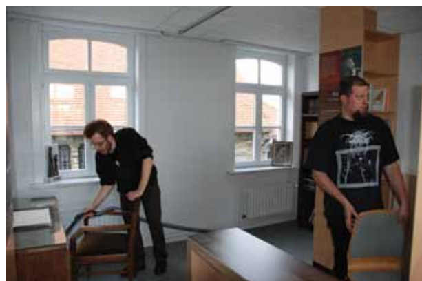
De laatste zaken op orde brengen in het André Demedtsmuseum

raam) en waren we voortrekker bij de vernieuwing van het André Demedtsmuseum in Sint-Baafs-Vijve (zie ook bladwijzer 1). Op die manier wil de Juliaan Claerhout-kring echt een dynamische indruk nalaten op het brede publiek.