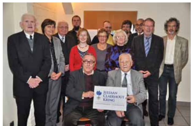
Feest van de vrijwilliger

De algemene vergadering verenigt alle bestuursleden. Ze beslist alleen over de grote krijtlijnen, zoals bv. de prijs van de jaarboeken, eventuele vergoedingen, aankoop van groot materiaal, publieke standpunten... De vergadering duurt nu nooit langer dan twee uur, behalve als er achteraf nog op iets geklonken moet worden. De algemene vergadering komt twee- à driemaandelijks samen, altijd op zaterdagvoormiddag. Dat tijdstip werd doelbewust geprikt in functie van de drukke weekagenda van de jongere bestuursleden. De korte en efficiënte vergaderingen op een zaterdagvoormiddag zijn een belangrijke troef om jonge en/of nieuwe mensen te overtuigen om eens 'de kat uit de boom te komen kijken' bij een beginnend engagement. Ze kunnen zo stapsgewijs in de heemkring rollen.