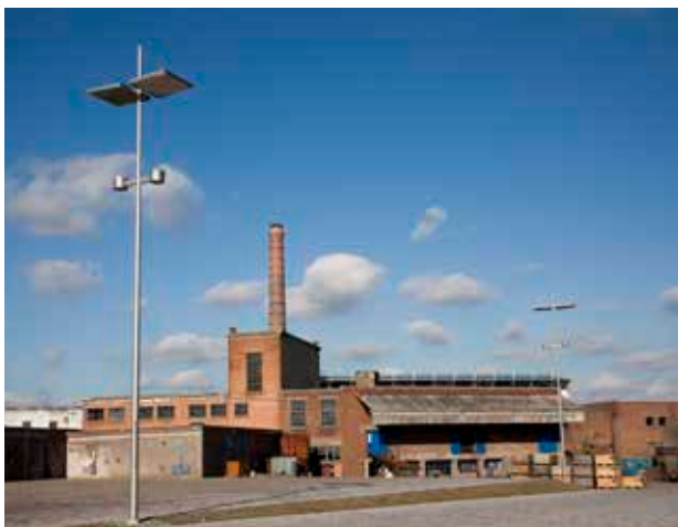
De stoomstroopfabriek in Borgloon

Zo trok de erfgoedraad van Borgloon in 2013 aan de alarmbel: als er niet snel iets gebeurde, zou de stoomstroopfabriek, beroemd dankzij een overwinning in De Monumentenstrijd in 2007, reddeloos verloren zijn. De gemeente had immers een aantal maanden daarvoor beslist dat er geen geld meer was voor de restauratie van de fabriek. De acties van de erfgoedraad hadden effect: mede door het voortdurend op de agenda plaatsen van dit heikele dossier, er steeds weer opnieuw aandacht voor te vragen en te wijzen op de toekomstmogelijkheden voor dit unieke stuk industrieel erfgoed werd de stoomstroopfabriek terug opgepikt. Recent werden de investeringsplannen herbekeken, budgetten voorzien en in een concrete aanbesteding gegoten. Als alles goed gaat zullen de werken in het voorjaar van 2016 van start kunnen gaan.