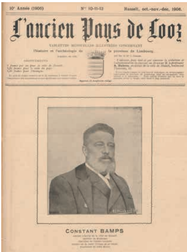
Voorpagina van L'ancien Pays de Looz (1906), nr. 10-12.

Wie de catalogus van de eerste veiling openslaat, ziet meteen de grote rijkdom van de verzameling: boeken, tijdschriften, gravures, handschriften, archiefdocumenten, archeologie, briefwisseling, juwelen, munten, medailles, tin, koper, meubels, opgezette vogels, herbariumvellen, enzovoort. Het geheel weerspiegelt Bamps' brede activiteiten en interesses: geneeskunde, natuurwetenschappen,