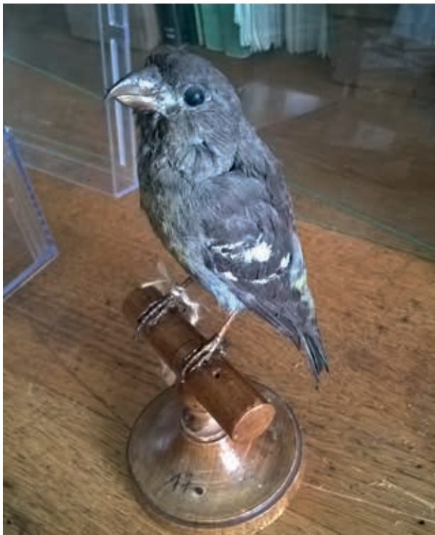
Witbandkruisbek Uit de collectie van het Koninklijk Belgisch Instituut voor Natuurwetenschappen.