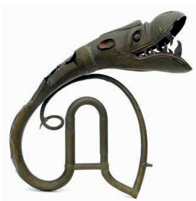
Schalbeker van een buccin

Gedrukte cursussen bestonden niet en de studen-