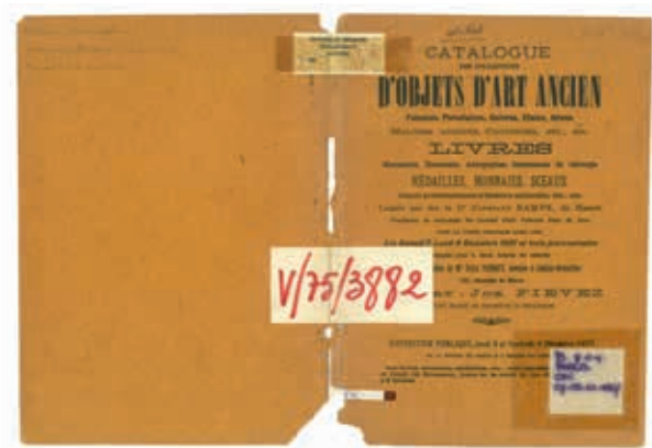
Titelblad van de veilingcatalogus uit 1907