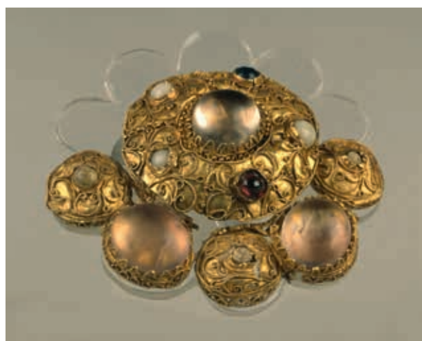
Hasselt: de mantelspeld met de laatste montage in de Koninklijke Musea voor Kunst en Geschiedenis

Van deze stukken was de herkomst bekend, maar door het verband te leggen met de veilingcatalogus van dokter Bamps, krijgen de verhalen achter de stukken een nieuwe dimensie.