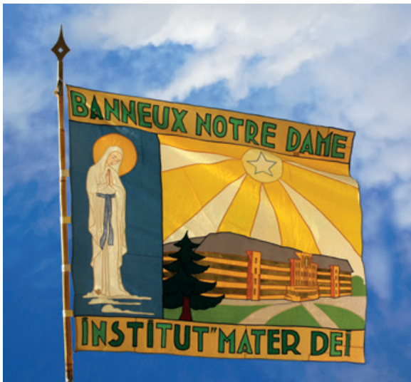
Handgemaakte vlag van het instituut Banneux met schets van het instituut en dennenboom waarboven de gele ster van Banneux prijkt, ca. jaren 1940 (Collectie CEAH, V19.19).

moment, et il m'intéresserait beaucoup de connaître des exemples d'instituts qui entrent dans la voie nouvelle au sujet de laquelle je me suis expliquée dernièrement. Je me permet de joindre copie d'une note à ce sujet. 7