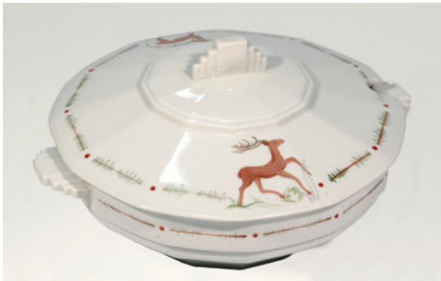
Handgeschilderd porseleinen soepkom: onderdeel van 40-delig servies. Tekeningen ontworpen door Pierre en Maria Van Humbeeck-Piron, met de hand geschilderd door de leerlingen (Collectie CEAH, Onderkant herkenningstekens Banneux V 7.23).

de ontwerpen, zijn vrouw Maria Piron liet hen schetsen in de vrije natuur. De leerlingen werkten met hout, koper, leder, glas, klei, pitriet en wol. Ze maakten ontwerpen voor vloertegels, wenskaarten, kazuifels en tapijten. Daarnaast leerden ze ook fijn handwerk. De tapijten en kussens van de grote kapel waren het werk van deze leerlingen. Tijdens dat ene schooljaar werden talrijke projecten afgewerkt. In het archief van Heverlee bevinden zich nog door hen vervaardigde stukken houtsnijwerk en beschilderd porselein met Ardense taferelen. 24