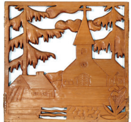
Houtsnijwerk Art et Artisanat Banneux: paneel van gesculpteerde lijst in dennenhout. Omvatte Onze-Lieve-Vrouw van Banneux en zeven houtsnijwerkjes met Ardense taferelen (Collectie CEAH, V 7.22, foto Danny Brison).