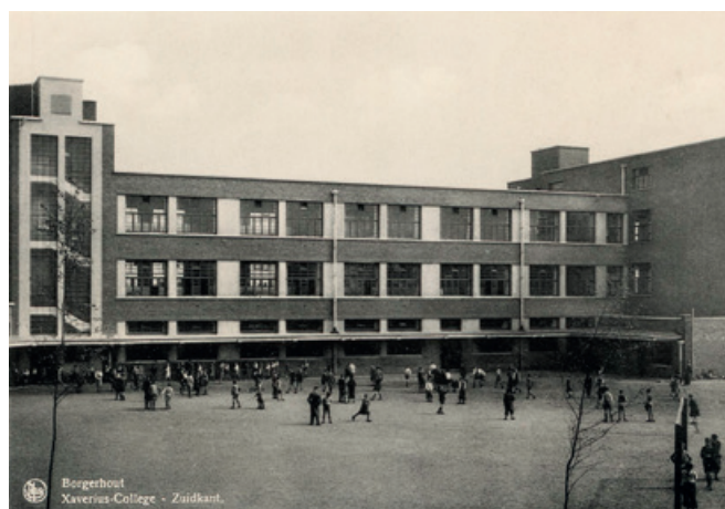
Foto's van de gebouwen Xaveriuscollege Borgerhout, ongedateerd.