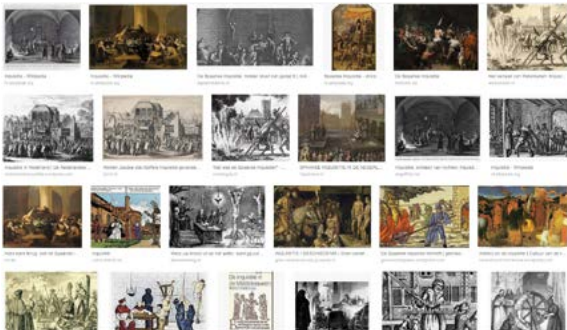
Dit screenshot van de resultaten van de zoekterm 'inquisitie' op Google Afbeeldingen illustreert de uiterste negatieve beeldvorming die over het fenomeen inquisitie bestaat. Die perceptie gaat terug op propaganda uit de zestiende eeuw. (screenshot Google Afbeeldingen)

de mythificatie die al in de zestiende eeuw begon en onze moderne blik, bepaald door verlichtingswaarden, maken het erg lastig om het fenomeen inquisitie te vatten.