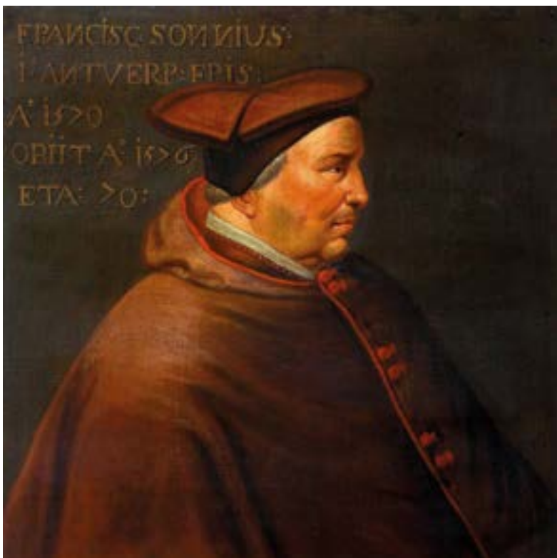
Portret van bisschop Franciscus Sonnius bij zijn aantreden als bisschop van Antwerpen in 1570. Sonnius (1506-1576) had theologie gestudeerd in Leuven en was kanunnik van het Sint-Janskapittel in 's-Hertogenbosch. In opdracht van de regering voerde hij inquisitieopdrachten uit in Gelderland en Friesland. Zijn voorstellen voor een reorganisatie van de bisdommen werden in de jaren 1560 grotendeels gerealiseerd.