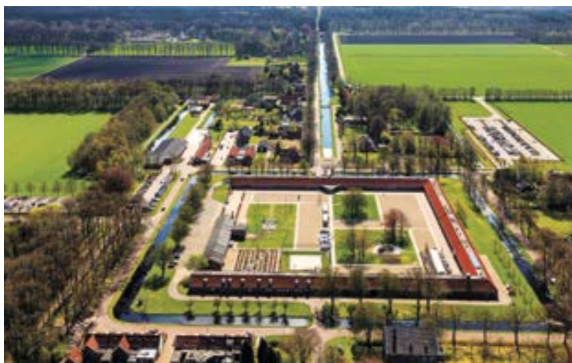
Onvrige kolonie Veenhuizen.