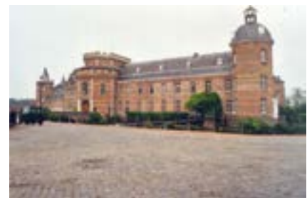
Kasteel van Hoogstraten.