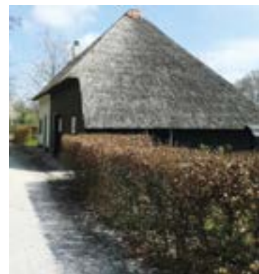
Model boerderijtje vrije kolonie Frederiksoord.

Op de gronden die werden aangekocht onder bescherming van het koningshuis, ontstonden grote complexen die gericht waren op een gedwongen vorm van samenleven. Concreet ging het om de koloniën van Veenhuizen, Frederiksoord, Willemsoord, Wilhelminaoord en Ommerschans. Men maakte het onderscheid tussen de 'vrije' en de 'onvrije' koloniën. De vrije koloniën gaven opvang aan arme gezinnen die een klein boerderijtje met een stuk grond kregen, plus een kleine 'uitzet' van vee en materiaal om de grond te bewerken. Men kon door de opbrengsten van de gronden zijn vrijheid afkopen, echter pas nadat de middelen die door de Maatschappij waren verleend, terugbetaald waren. De financiële input was zowel nationaal als regionaal. Dit laatste kenmerk vertaalde zich in geldelijke bijdragen van de gemeenten waaruit de paupers afkomstig waren. Bij het ontwerp van het project werd er aanvankelijk niet uitgegaan van gedwongen opnames. De eerste koloniën waren 'vrij'. Pas later was er ook sprake van de 'onvrije' koloniën voor de opvang van landlopers en bedelaars. Landloperij en bedelarij stonden in die tijd immers geboekstaafd als criminele activiteiten. In de onvrije koloniën gold een strikt, ietwat militair regime. De inrichting verschilde in die zin van de vrije koloniën dat de bedelaars en landlopers collectief werden ondergebracht in een groot, rechthoekig gebouw. Aan de binnenzijde van deze structuur waren de verblijfsruimten van de kolonisten, aan de buitenzijde die van het personeel.