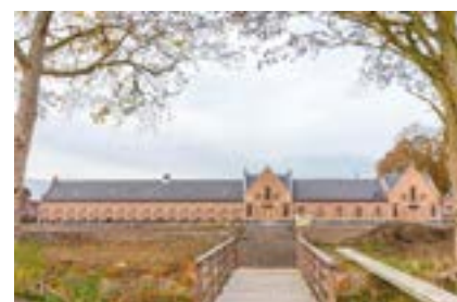
Grote Hoeve Rijksweldadigheidskolonie Merksplas.

Voor alle duidelijkheid moet nogmaals worden benadrukt dat de gedigitaliseerde gegevens op dit ogenblik nog niet voor het publiek zijn opengesteld. Aan de software voor een gebruiksvriendelijke zoekmachine wordt momenteel nog volop gewerkt.