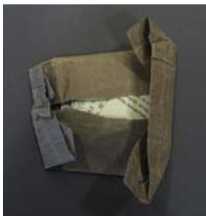
Clandestiene briefjes opgevouwen in een bundeltje. (RA Brugge, ROG Brugge, 830, 2)

Hoewel het anonimiseren van gegevens tot doel heeft de identificatie met personen te verhinderen, biedt het geen garantie op bescherming. Dit kan vooral in kleine gemeenschappen een risico zijn. Voor outsiders is de identiteitsbescherming dan wel gegarandeerd, maar niet noodzakelijk voor insiders . Martin Tolich benoemde dit onderscheid als 'external' en 'internal confidentiality'. 21 Deze interne confidentialiteit slaat op de mogelijkheid voor onderzoekssubjecten om elkaar te identificeren door een publicatie, zelfs indien de persoonsgegevens werden veranderd. Dit hóeft niet noodzakelijk