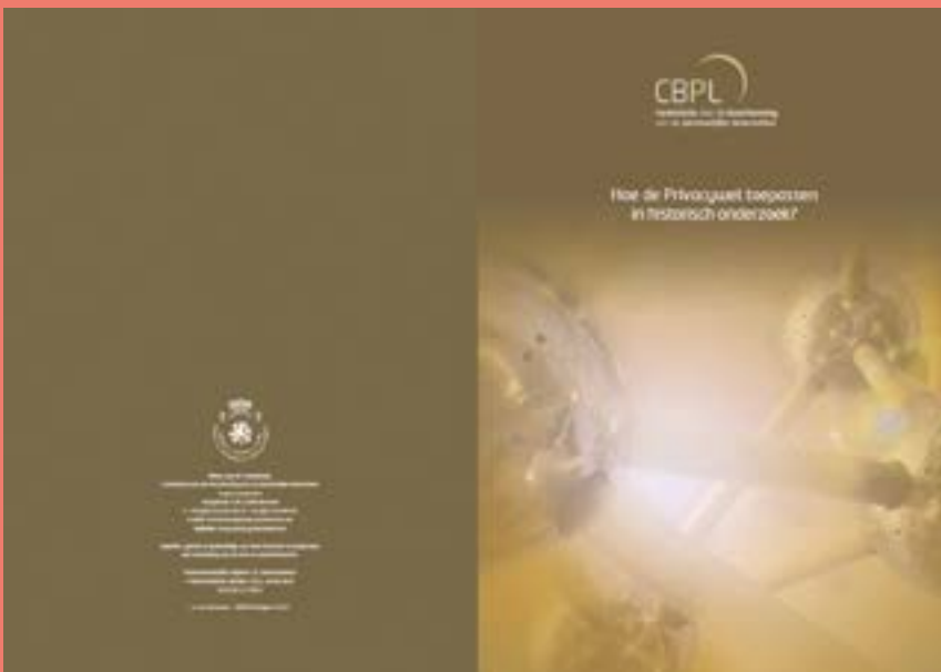
De privacycommissie bracht een handig vademecum uit voor historici: hoe de privacywet toepassen in historisch onderzoek?

hoe dan ook een vervorming van het 'gebeurde', zodat het gebruik van de 'echte' naam geen meerwaarde levert. Tot slot circuleren twee conflicterende invullingen van postume waardigheid. Voor de ene bestaat deze erin de privacy van de overledenen te beschermen, voor de andere zorgt net de identificatie voor een waardige behandeling van het historische subject. Ik claim geenszins dat dit de enige vragen zijn die aan de orde zijn, noch dat dit de enige mogelijke argumenten zijn. Met dit artikel pleit ik evenmin voor een uniforme richtlijn vóór of tegen anonimisering. Maar waar ik wel voor pleit is dat historici meer aandacht besteden aan de ethische implicaties van onderzoek met privacygevoelige bronnen.