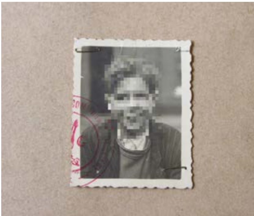
Wat met visuele bronnen? (Foto uit: RA Antwerpen-Beveren, M17 ROG Mol, 581, dossier 7019)