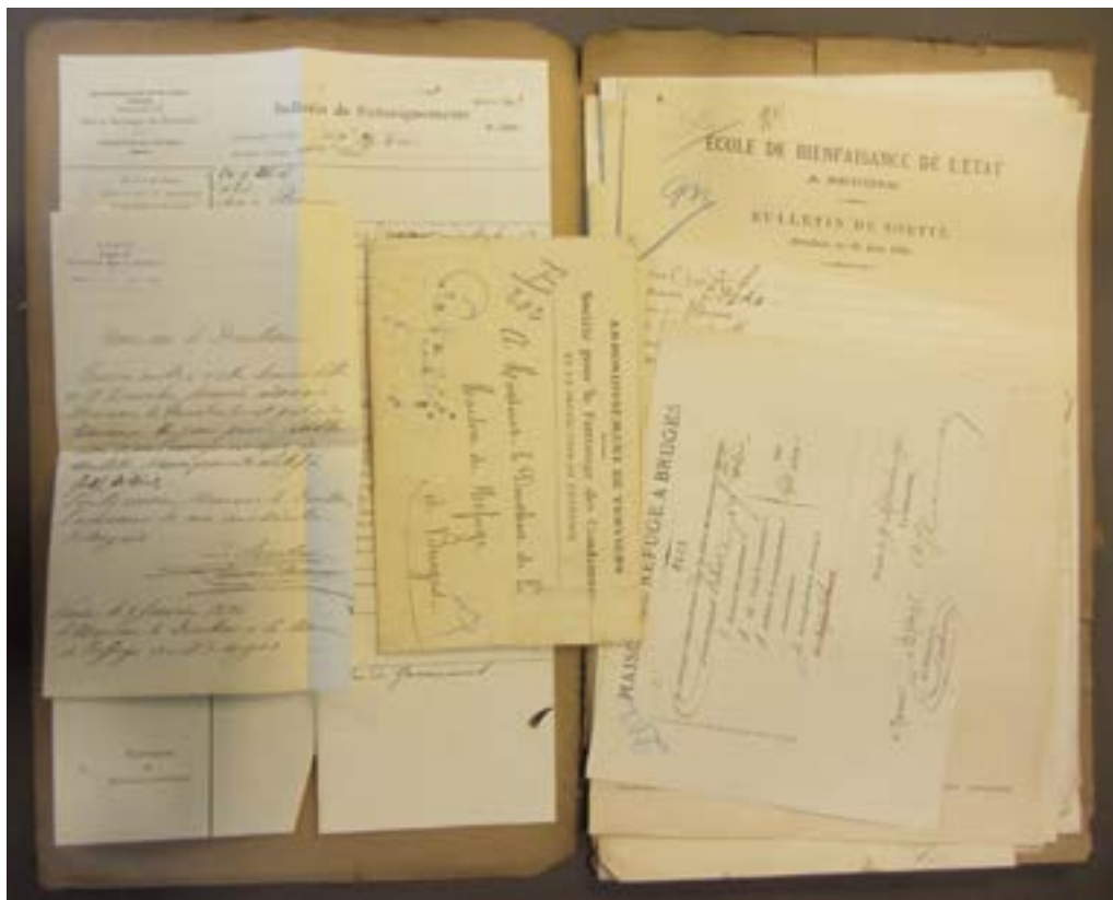
Het geanonimiseerde dossier van H.G. uit het Rijkswelddadigheidsgesticht van Sint-Andries, ca. 1893 (RA Brugge, M35, 1321, 202)

zelden geschreven bronnen hebben nagelaten. Bij het gebruik van bronnen opgesteld door penitentiaire inrichtingen, moeten historici echter waken over de privacybescherming van de historische subjecten.